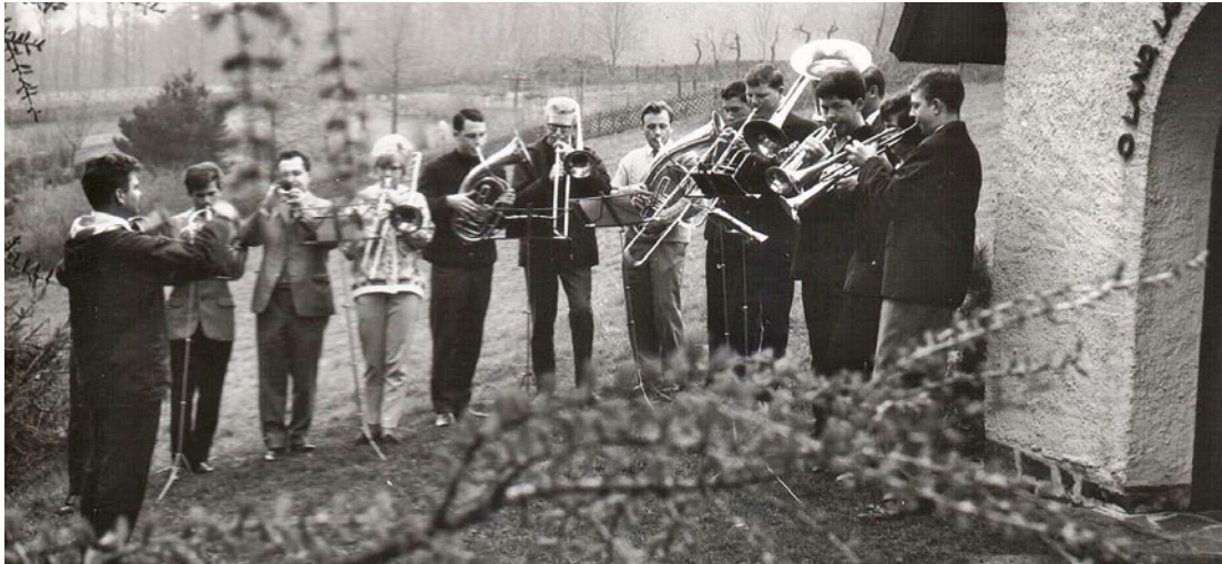
Ein Bild aus der Anfangszeit: hier spielt der Posaunenchor 1965 am Neutscher Kapellchen.