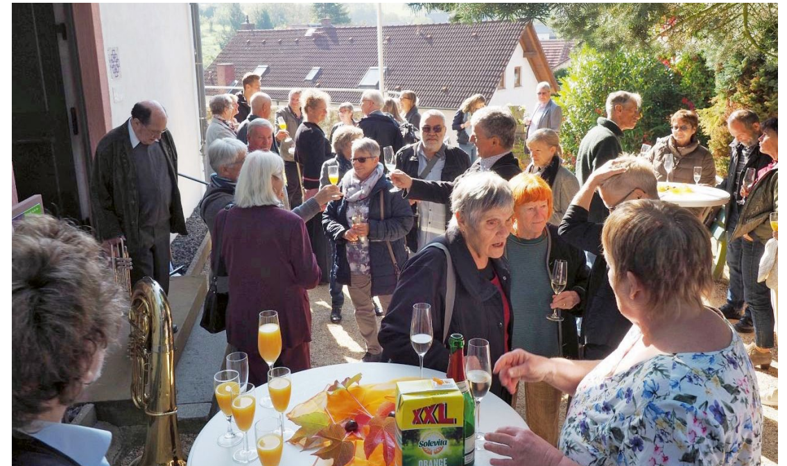
Nach dem Festgottesdienst: kleiner Sektempfang mit großem Hallo.