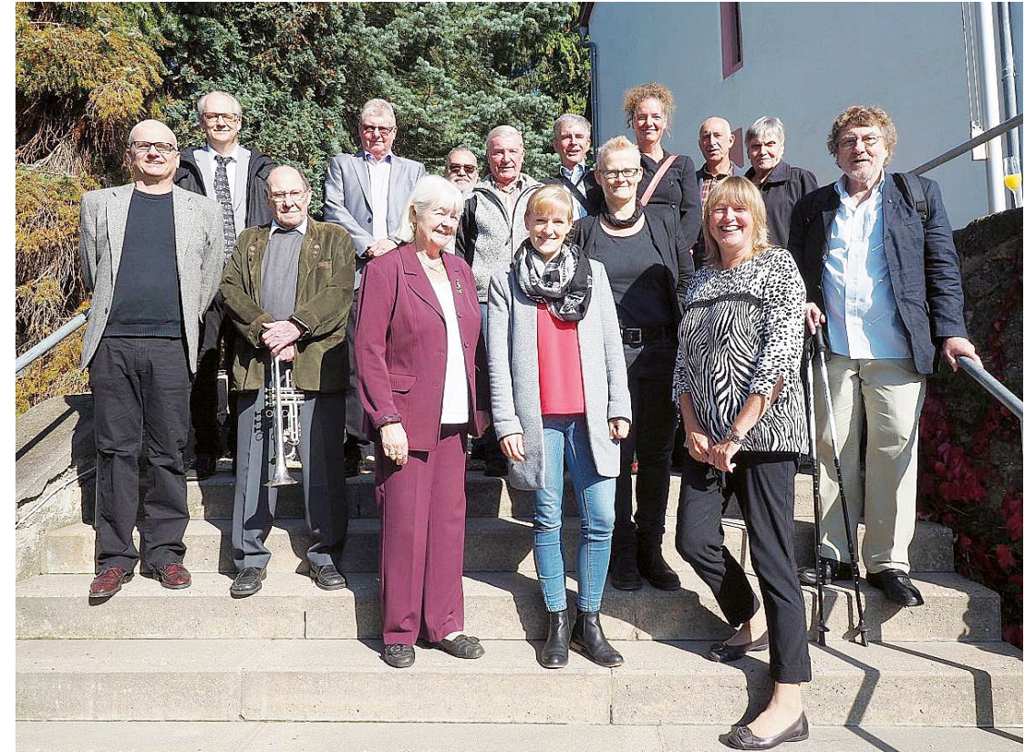
Gut aufgestellt: der Posaunenchor 2021.

Jubiläumsfeier nachholen. Am 10. Oktober wurde der Posaunenchor in einem Festgottesdienst für sein mittlerweile 61-jähriges segensreiches Wirken geehrt. Herzlichen Glückwunsch!