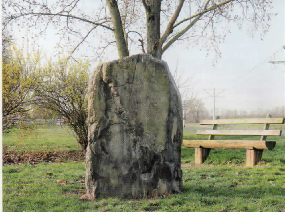
Ein uraltes Pilgerziel: der Alsbacher Hinkelstein.