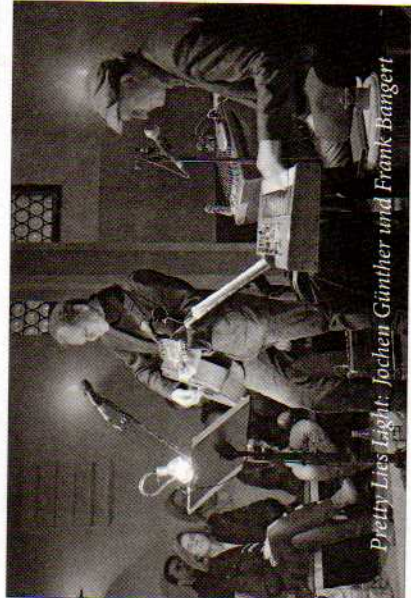
Bild: Pretty Lies Light

Eine Videoaufnahme gibts auf youtube unter http://www.youtube.com/watch?v=lnBZTS_oEEY .