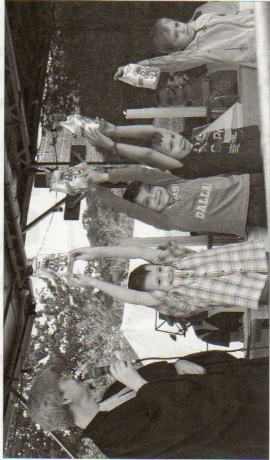
Sie lernen von nun an in der Schule: Vier Erstklässler freuen sich auf den Schulbeginn und auf ihr Geschenk, die essbaren Buchstaben.