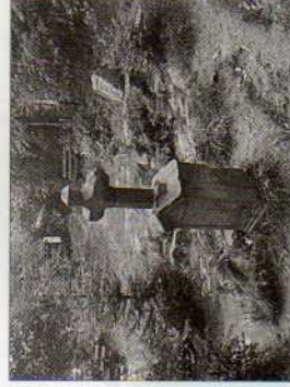
Siegfriedbrunnen in Graselbach

Sich mal verwöhnen lassen, ins Blaue, Grüne und Herbstbunte fahren, Schwätzen und Schlemmen – das alles können Sie auf unserer Halbtagsfahrt in den Überwald.