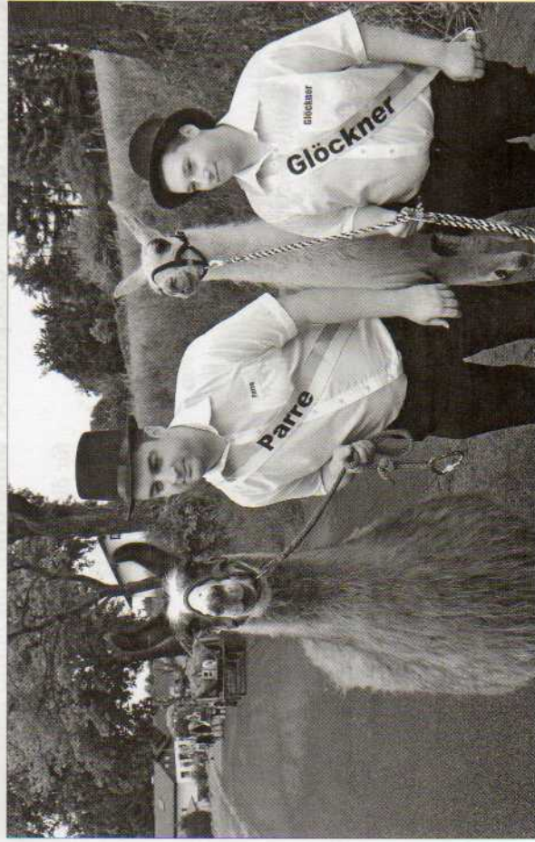
Da bleibt ihnen glatt die Spucke weg: Lamas lernen die Owerri-Beerwischer Kerb kennen, gut geführt von Parre und Glöckner.