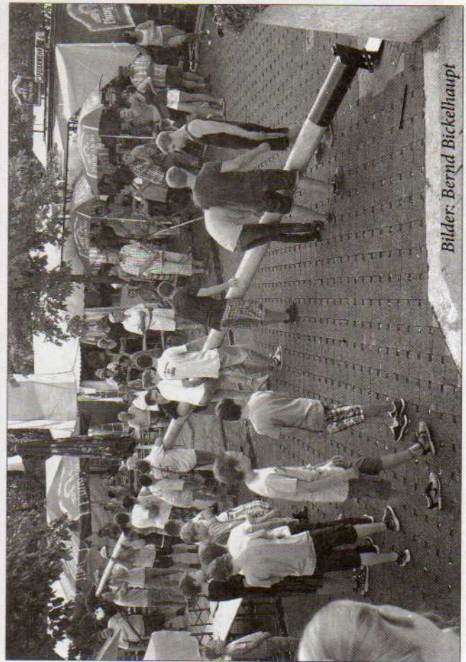
Bilder: Bernd Bickelhaupt