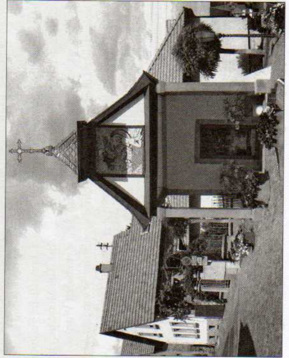
Kapelle von Sankt Martin in Sankt Martin