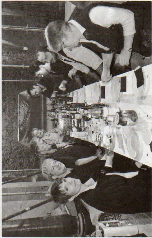
Baustellenvesper: Zimmerleute, Architekt und Kirchenvorstand „tafeln“ in der Kirche.

Nachdem wir uns gestärkt hatten, kam die Sonne zum Vorschein und lockte uns auf das Gerüst. Der Höhepunkt – im wahrsten Sinne des Wortes – war der Besuch beim goldenen Hahn auf